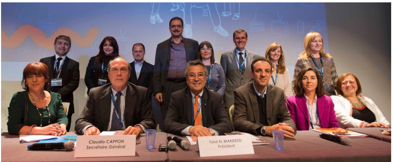
Les représentants du Comité de Direction élu à Ajaccio

Lien à la résolution finale d'Ajaccio adoptée par l'Assemblée Générale