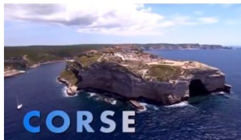
Spot promotionnel de la Conférence réalisé par France 3 Corse ViaStella