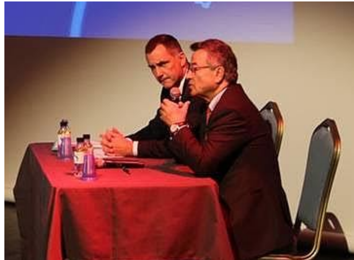
Ouverture officielle, Palais des Congrès Lien au discours du Président du Conseil exécutif de Corse, M. Gilles Simeoni