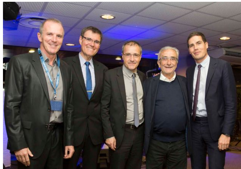
Dîner spectacle, Terrasse du Palais des Congrès Lien au discours du Président de l'Assemblée de Corse, M. Jean-Guy Talamoni