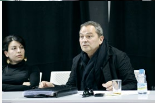
LE PUBLIC SYSTÈME CINÉMA Bruno Barde