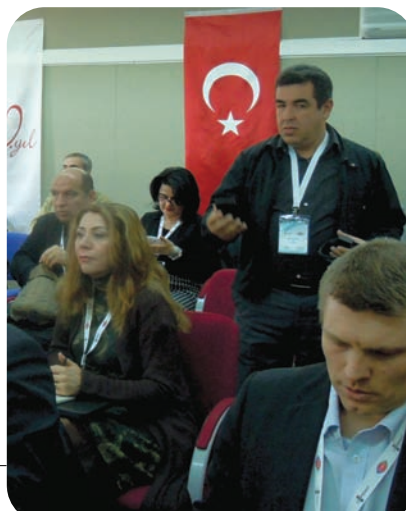
Le groupe de participants lors d'une des journées de formation du Forum

Ina Expert Chef de file - France AQSHF Central State Film Archive in Tirana Albanie COPEAM HAVC Croatian Audiovisual Centre Croatie