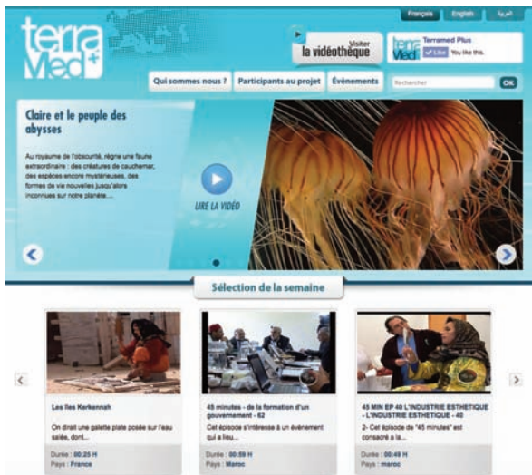
La page d'accueil de www.terramedplus.tv