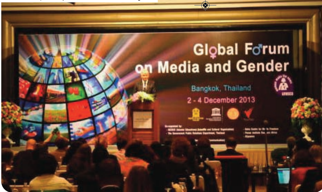
Forum Mondial Femmes et Médias de l'UNESCO à Bangkok