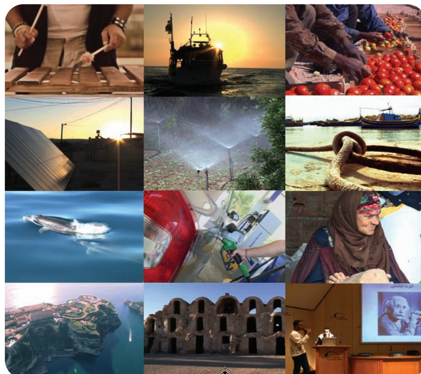
Un aperçu des 12 docu-mags de Joussour

Enfin, le travail déployé sur cette série de qualité a été couronné par l'octroi de deux Prix aux docu-mags jordanien et palestinien : en septembre dernier, au Prix Italia, « La vallée du Jourdan et les mouches maudites » - réalisé par la JRTV avec la production exécutive de la RAI - a gagné le Prix Spécial « Expo 2015 : Nourrir la planète, énergie pour la vie » ; en mars 2014, « Sun rays : Energie solaire en Palestine » - produit par la PBC avec la production exécutive de la RAI - a été récompensé dans le cadre du « Concours 2014 de Journalisme du Gouvernement Local », organisé par le Ministère des Collectivités Locales palestinien avec le soutien de l'agence de coopération allemande GIZ.