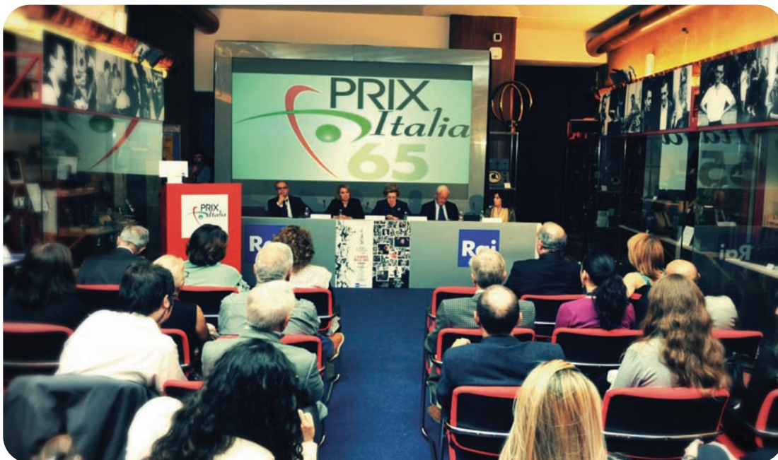
Rencontre COPEAM au Prix Italia 2013

Cette rencontre trilatérale constitue une opportunité régulière d'échange entre ces Unions autour des différents projets et des initiatives conjointes, avec un focus particulier sur les activités de formation et de coproduction, permettant ainsi de faire un bilan périodique des actions en cours et d'explorer les possibilités de coopération à venir.